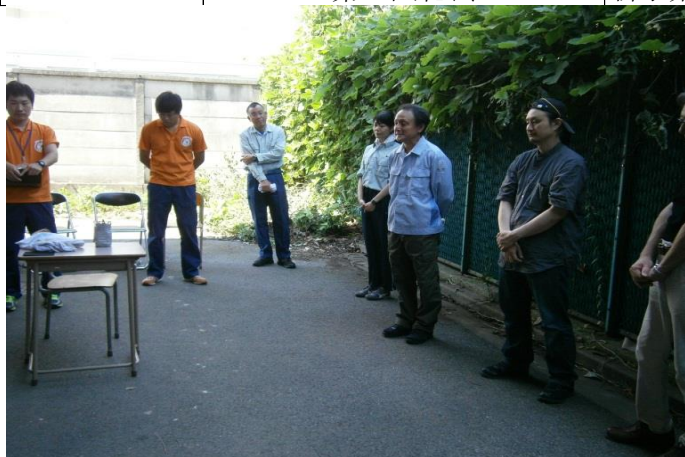
始まり時 「各自挨拶」