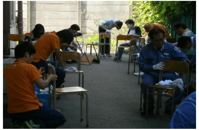
机・椅子補修 「錆落としのヤスリがけ」