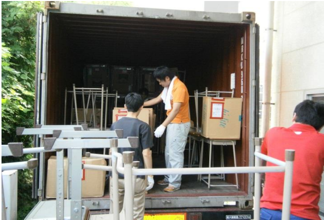
コンテナ積み込み途中