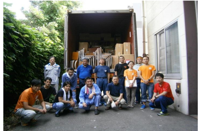
コンテナ積み込み終了後、皆で記念撮影

ご協力頂きました区民ボランティアの方々、関係者の方々、会員各社の方々、お疲れ様でした。 暑い中、怪我もなく、順調に作業を行うことができました。