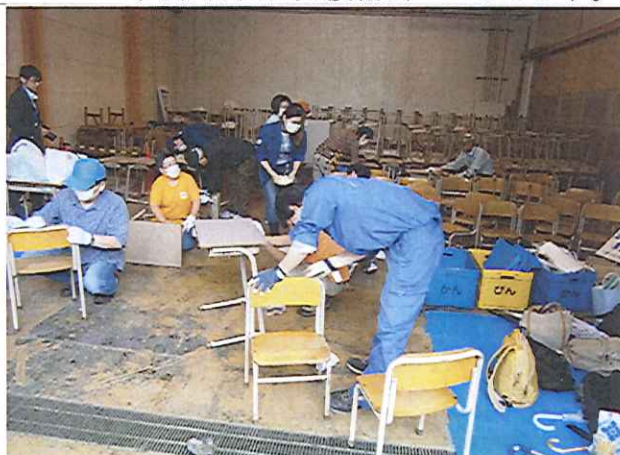
机・椅子補修 「錆落としのヤスリがけ」