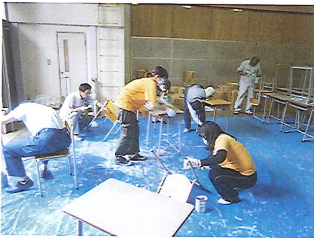
机・椅子補修 「ペンキ塗り」の様子